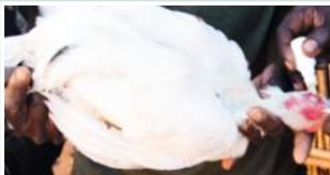
Figuras 15 e 16: Vacinação de aves para controlo de doença de Newcastle ● Fonte: CITT/PVSM. Figures 15 and 16: Poultry vaccination for Newcastle disease control ● Source: CITT/PVSM.