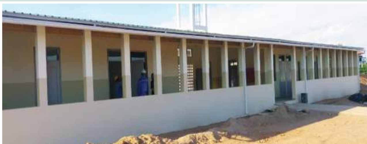
Figuras 40, 41 e 42: Centro de Saúde tipo 2 de Mugoliwa, construído pelo PVSM