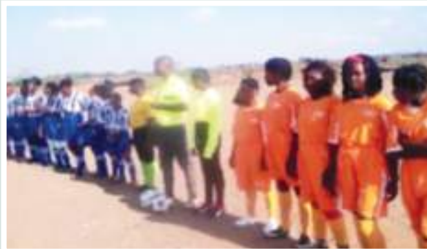
Figuras 37 e 38: Entrega de equipamento desportivo no âmbito de promoção de futebol feminino