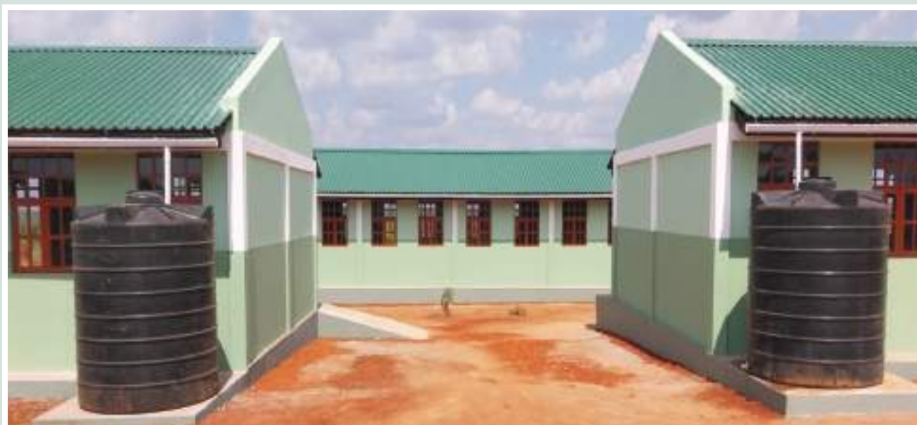
Figura 28: Escola Primária Completa de Lugane, depois da intervenção do PVSM