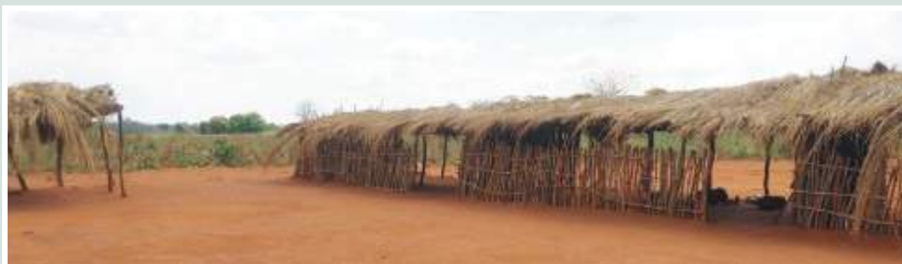
Figura 27: Escola Primária Completa de Lugane, antes da intervenção do PVSM • Fonte: CITT/PVSM.