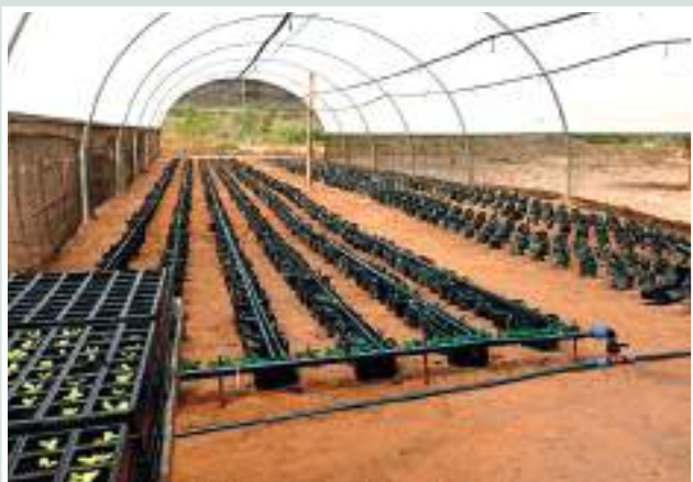
Figuras 5 e 6: Estufa agrícola para o treinamento dos produtores

Figures 5 and 6: Agricultural greenhouse for producer training