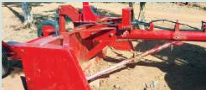
Figuras 52,53, 54 e 55: Equipamento de manutenção de estradas entregue ao Governo do Distrito de Molumbo pelo PVSM ● Fonte: CITT/PVSM.