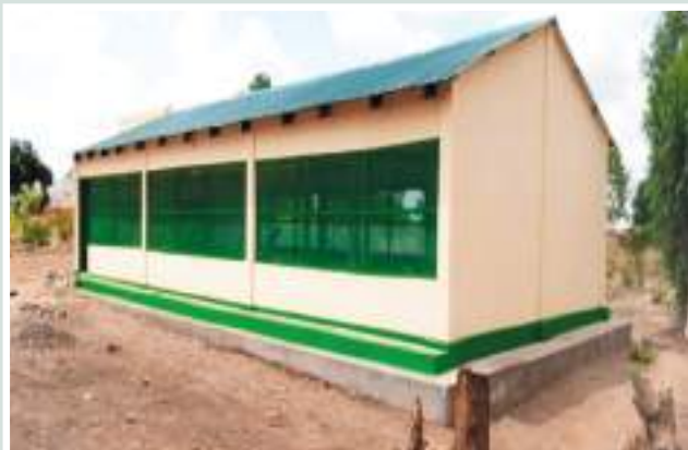
Figura 3: Aviário-Escola ● Fonte: CITT/PVSM.

Figure 3: Poultry-School ● Source: CITT/PVSM.