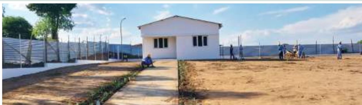
Figura 45: Casa do Enfermeiro no Centro de Saúde de Mugoliwa

Figures 43 and 44: Side view of Mugoliwa Health Center