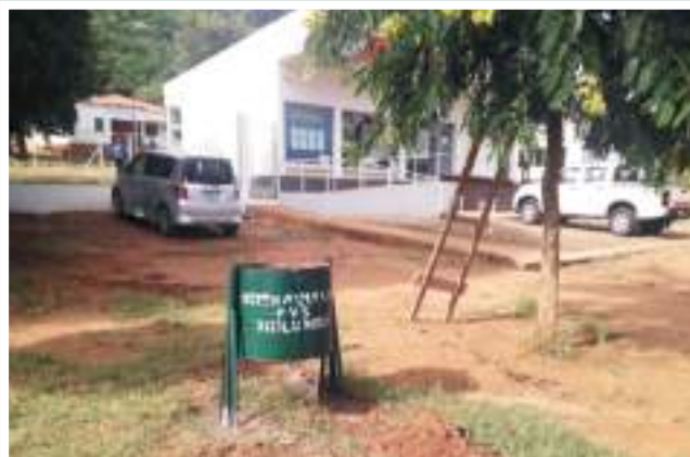
Figuras 57 e 58: Lajes para latrinas melhoradas (esq.) e tambores de lixo no povoado de Mongessa (dir.)

Figures 57 and 58: Slabs for improved latrines (left) and trash drums in the village of Mongessa (right)