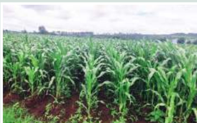
Figure 10: Truck in the process of loading cabbage for marketing