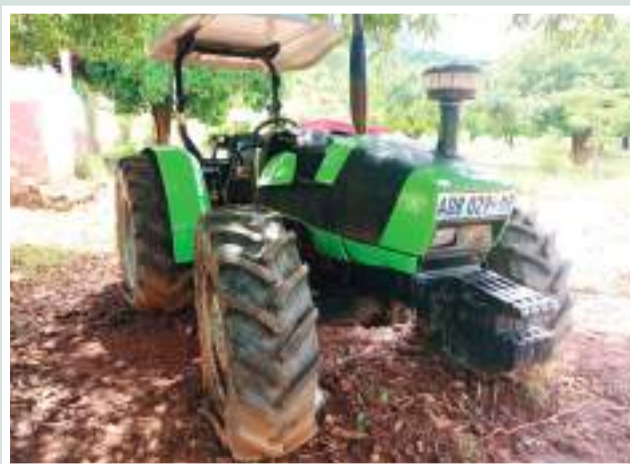
Figuras 7 e 8: Tractores e respectivas alfaias agrícolas