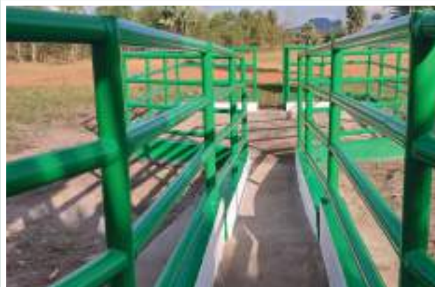
Figuras 1 e 2: Tanque carracida para tratamento de gado Figures 1 and 2: Tick-dip tank for cattle treatment