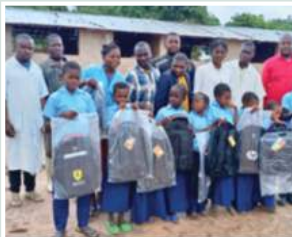
Figuras 34 e 35: Apoio à crianças desfavorecidas com material escolar Figures 34 and 35: Support to disadvantaged children with school supplies