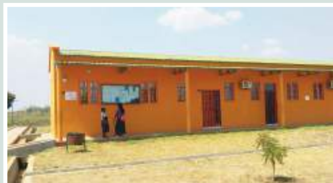
Figure 19: Side view of Molumbo Secondary School ● Source: CITT/PVSM.