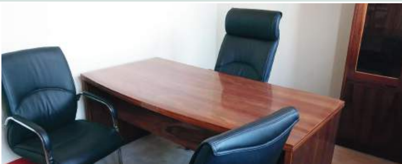
Figura 33: Gabinete do Director da Escola Primária Completa de Lugane • Fonte: CITT/PVSM.

Figure 32: Interior of the classroom of Lugane Complete Primary School • Source: CITT/PVSM.