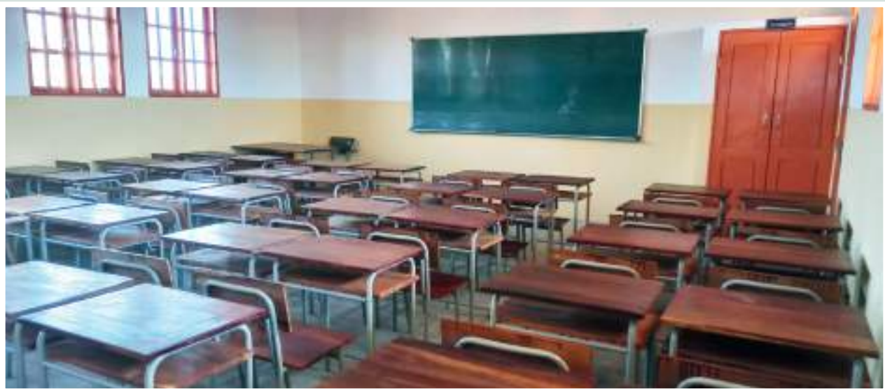
Figura 26: Sala de aulas da Escola Secundária de Molumbo • Fonte: CITT/PVSM. Figure 26: Classroom of Molumbo Secondary School • Source: CITT/PVSM.