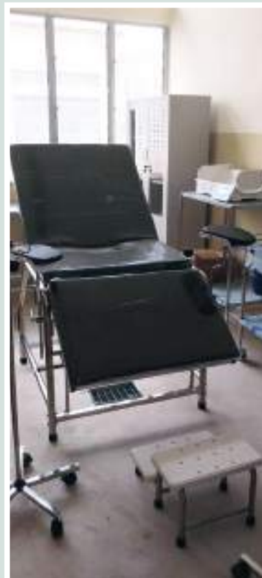
Figuras 46, 47 e 48: Equipamento de maternidade de Centro de Saúde de Mugoliwa