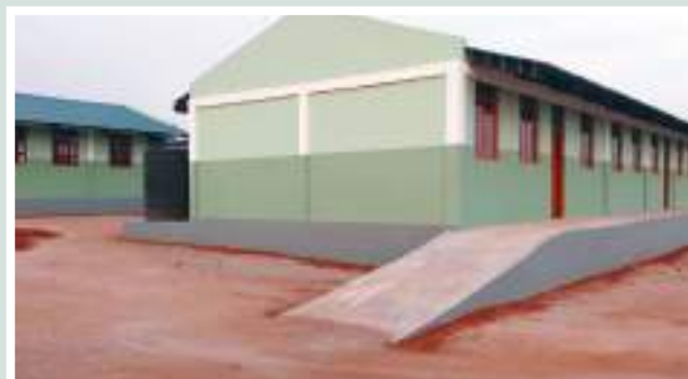
Figure 28: Lugane Complete Primary School, after the intervention of PVSM