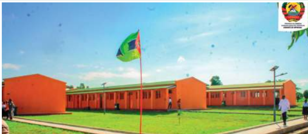
Figura 19: Vista lateral da Escola Secundária de Molumbo

Figure 19: Side view of Molumbo Secondary School