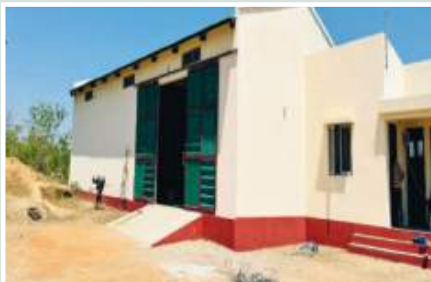
Figura 4: Armazém comunitário

Figure 3: Poultry-School