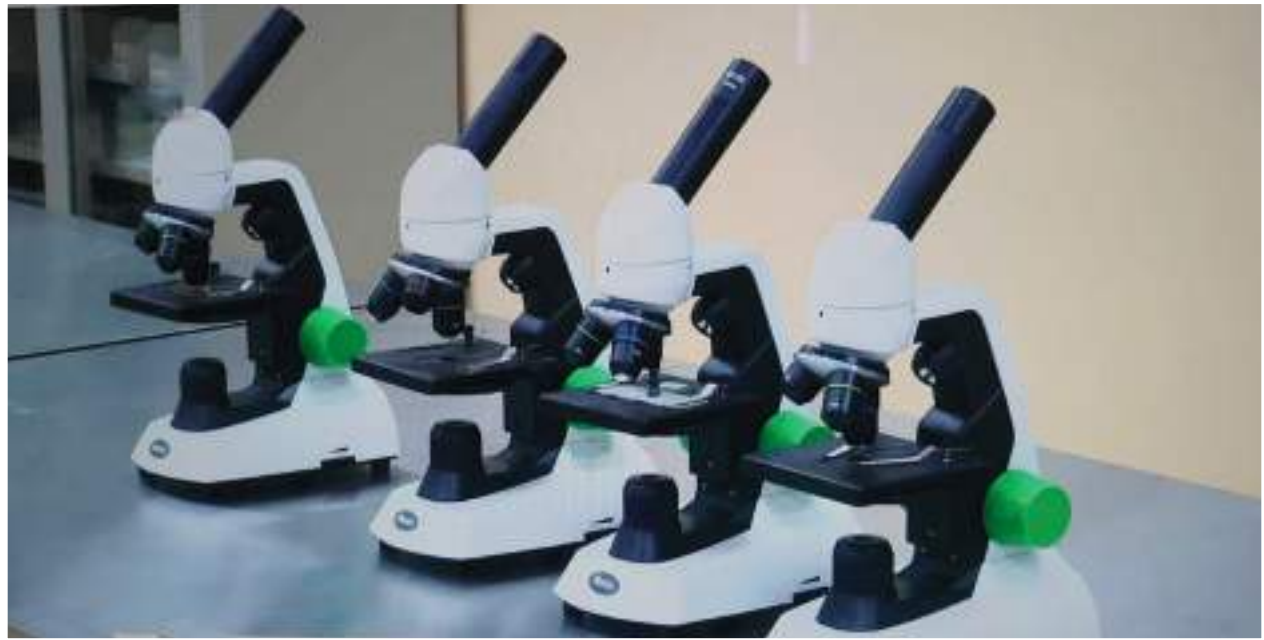
Figura 25: Equipamento do laboratório da Escola Secundária de Molumbo • Fonte: CITT/PVSM. Figure 25: Laboratory equipment of Molumbo Secondary School • Source: CITT/PVSM.