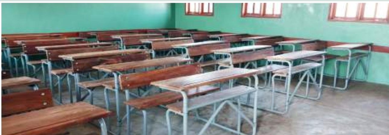
Figura 32: Interior da Sala de aulas da Escola Primária Completa de Lugane • Fonte: CITT/PVSM.

Figure 31: Classroom block of Lugane Complete Primary School • Source: CITT/PVSM.