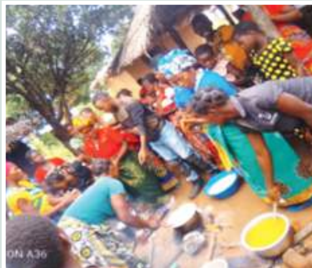
Figuras 50 e 51: Feira de saúde promovida pelo PVSM (a esq.) Oficinas de Nutrição (dir.)

Figures 50 and 51: Health fair promoted by PVSM (left) Nutrition workshops (right)