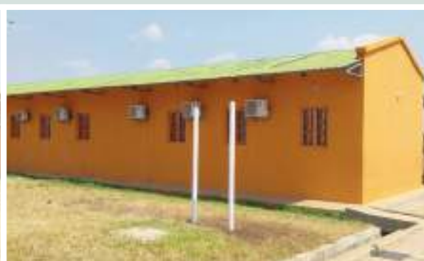
Figuras 20 e 21: Vista frontal do bloco administrativo da Escola Secundária de Molumbo

Figures 20 and 21: Front view of the administrative block of Molumbo Secondary School