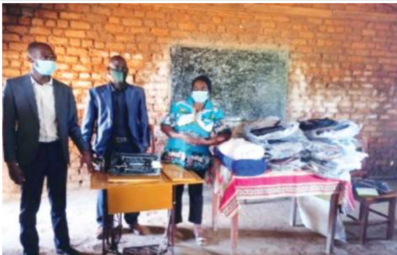
Figura 36: Entrega de Kit de costura para a formação de raparigas nas escolas

Figure 36: Delivery of sewing kit for girls' training in schools