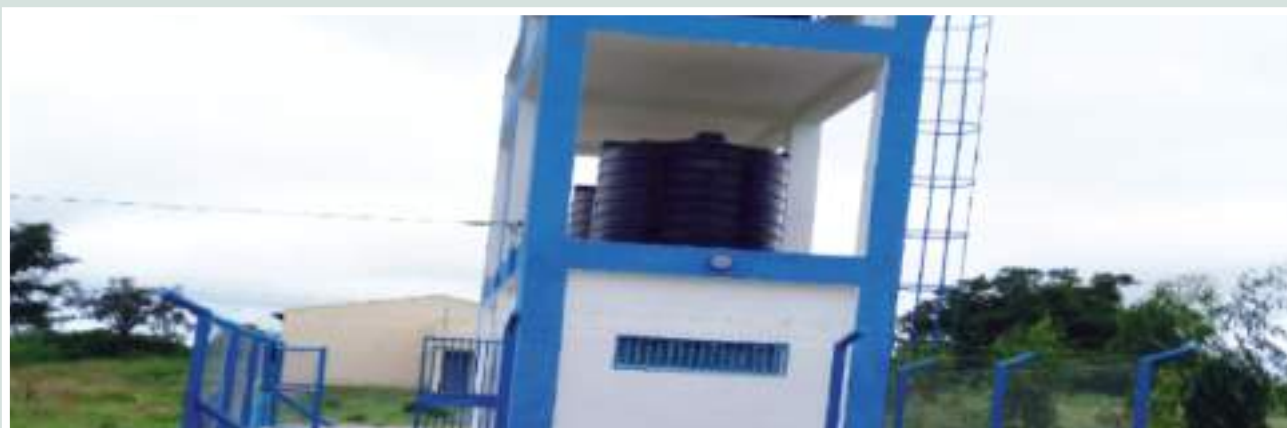
Figura 56: Sistema de abastecimento de água de Mugoliwa, construído pelo PVSM ● Fonte: CITT/PVSM.

Figure 56: Water supply system of Mugoliwa, built by PVSM ● Source: CITT/PVSM.