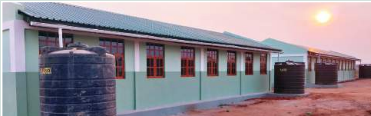
Figura 31: Bloco de sala de aulas da Escola Primária Completa de Lugane • Fonte: CITT/PVSM.

Figure 31: Classroom block of Lugane Complete Primary School • Source: CITT/PVSM.