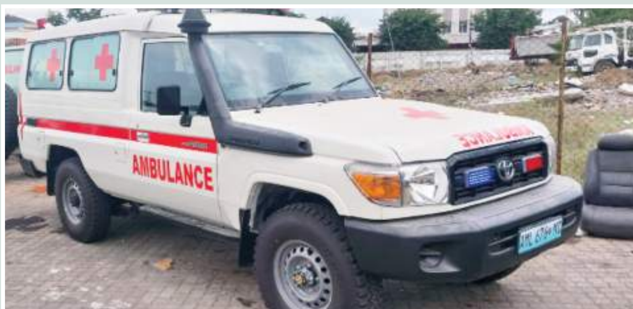
Figura 49: Ambulância entregue ao Centro de Saúde pelo PVSM