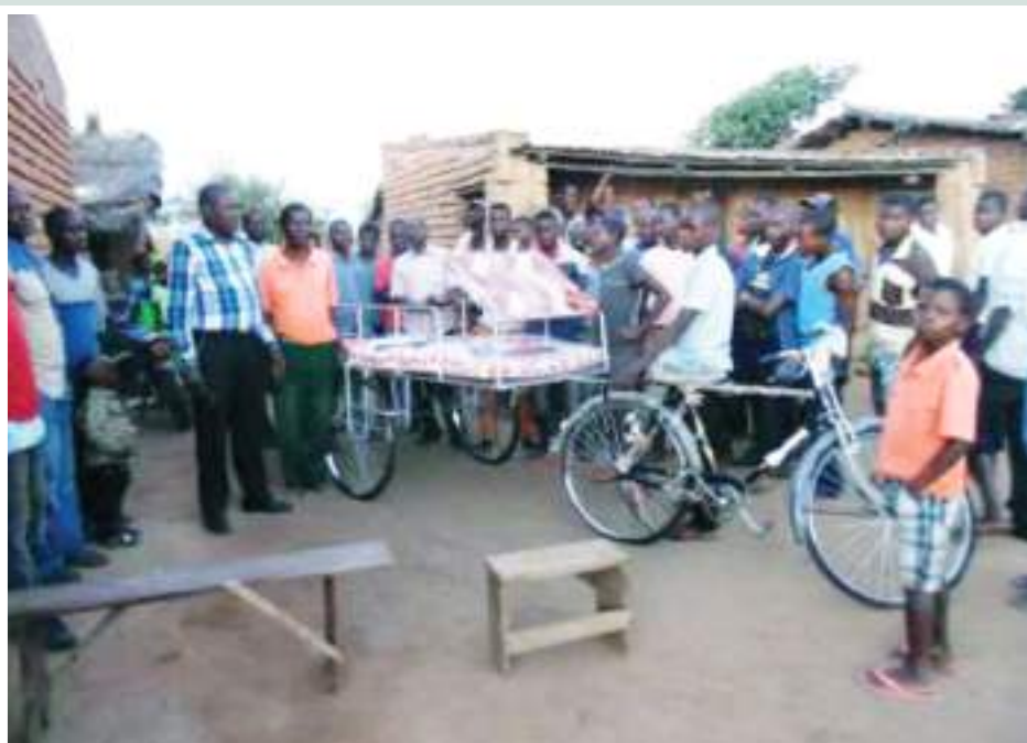
Figura 39: Bicicletas ambulâncias distribuídas nas comunidades pelo PVSM ● Fonte: CITT/PVSM. Figure 39: Bicycle ambulances distributed in the communities by PVSM ● Source: CITT/PVSM.