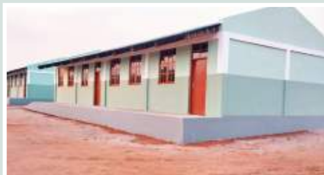
Figuras 29 e 30: Vista lateral da Escola Primária Completa de Lugane • Fonte: CITT/PVSM.