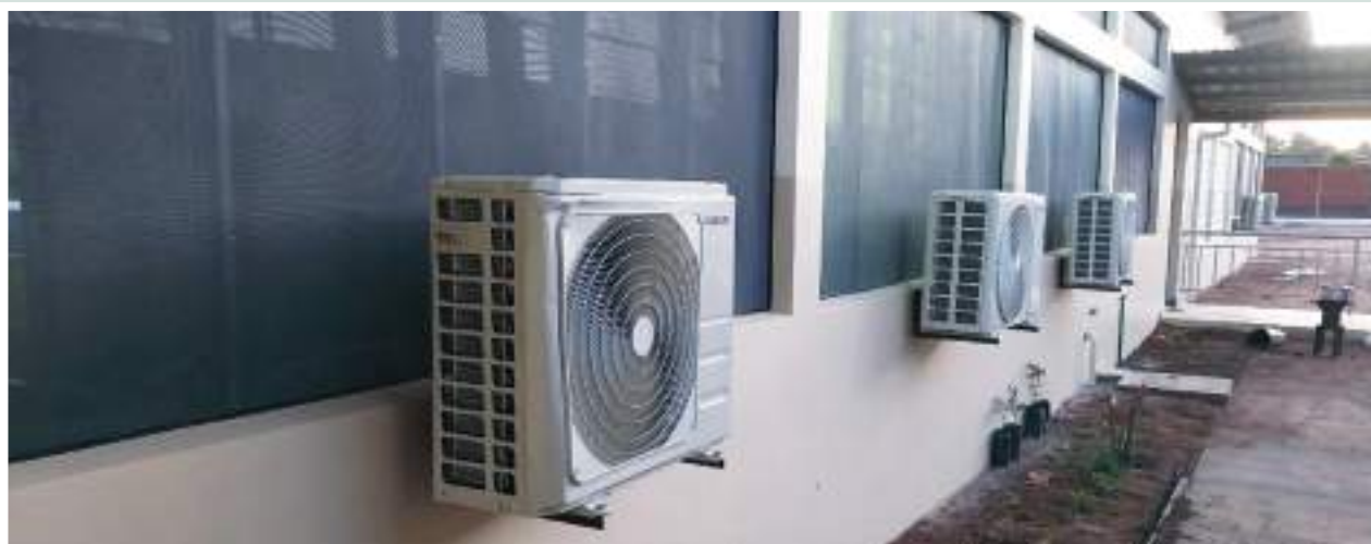
Figuras 43 e 44: Vista lateral de Centro de Saúde de Mugoliwa

Figures 43 and 44: Side view of Mugoliwa Health Center