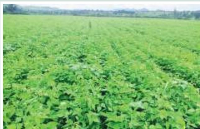
Figuras 11 e 12: Campos de demonstração de resultados de milho e feijões ● Fonte: CITT/PVSM.

Figures 11 and 12: Demonstration fields of maize and bean results ● Source: CITT/PVSM.