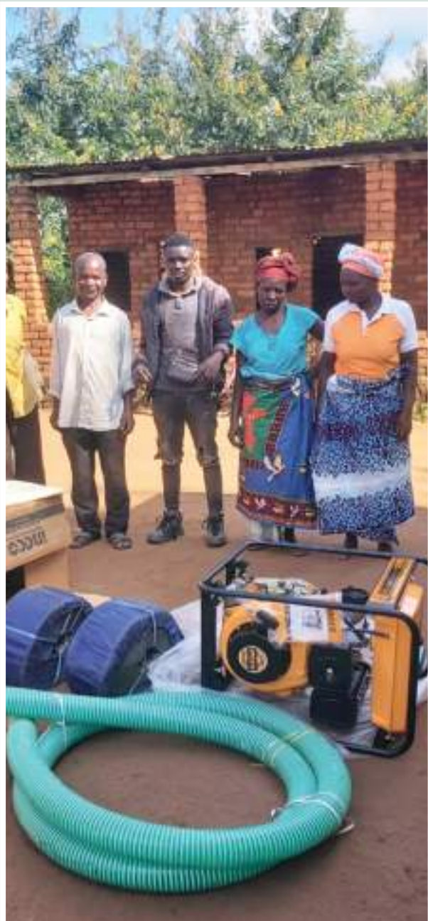
Figura 9: Motobombas para irrigação e respectivos acessórios

Figure 9: Motor pumps for irrigation and their accessories