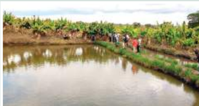
Figuras 13 e 14: Tanque piscícola ● Fonte: CITT/PVSM. / Figures 13 and 14: Fish tank ● Source: CITT/PVSM.