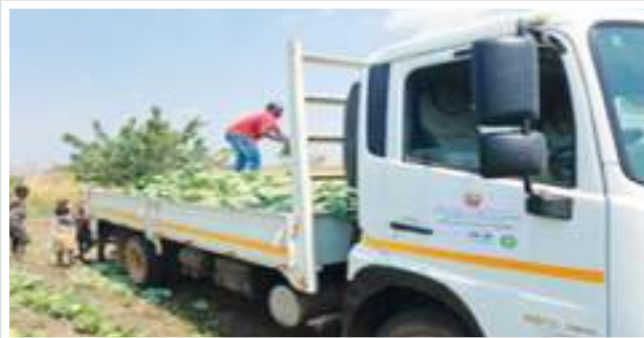
Figura 10: Camião em processo de carregamento de repolho para a comercialização

Figure 9: Motor pumps for irrigation and their accessories