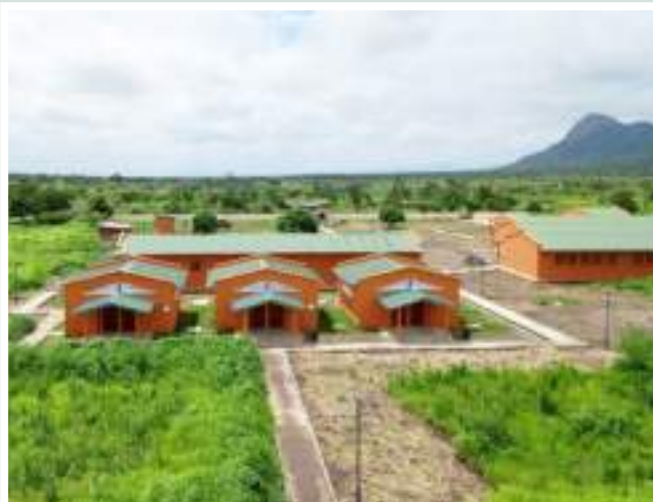
Figuras 17 e 18: Escola Secundária de Molumbo inaugurada por Sua Excelência Filipe Jacinto Nyusi, Presidente da República de Moçambique